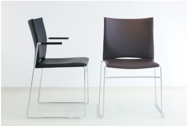
COM_PELLE P schwarz