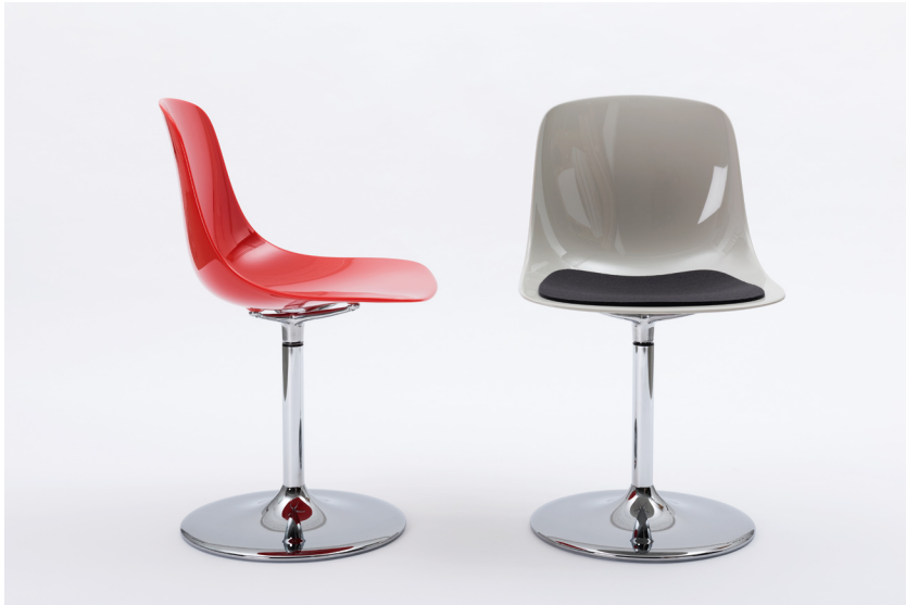
Abbildung PURE_AL/T weiß