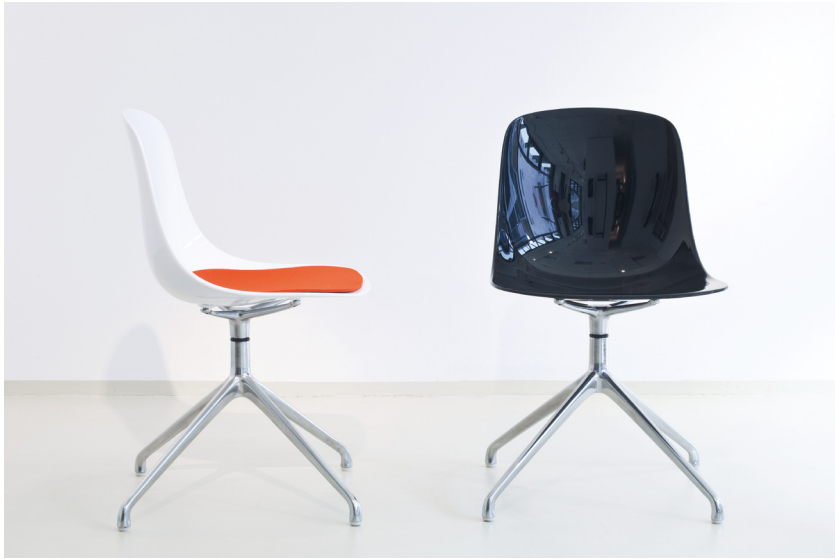
Abbildung PURE_AL weiß mit Sitzauflage Filz orange