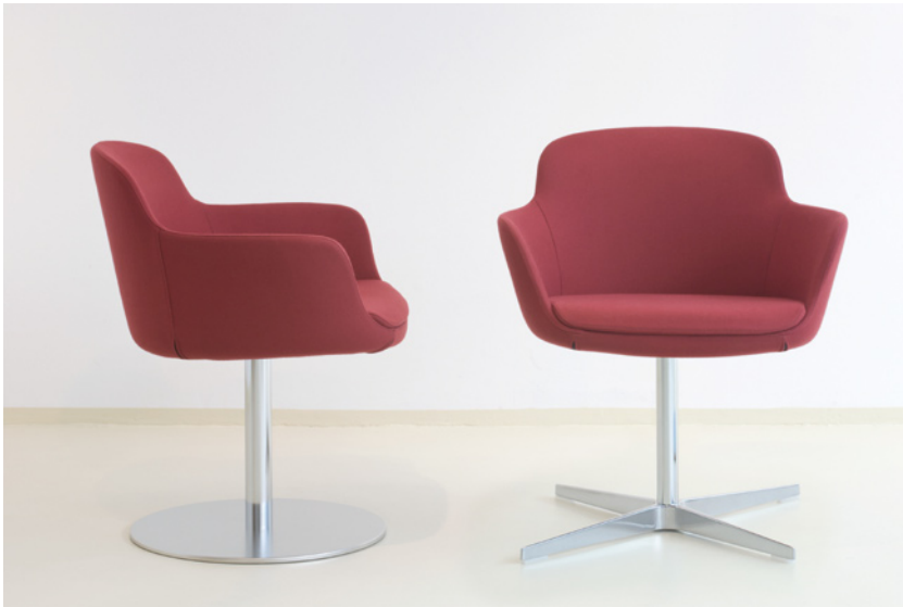
Abbildung mit Tellerfuß