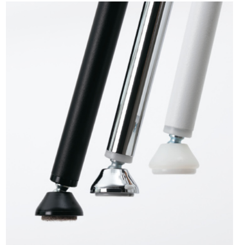
Gelenkgleiter für JOY_V