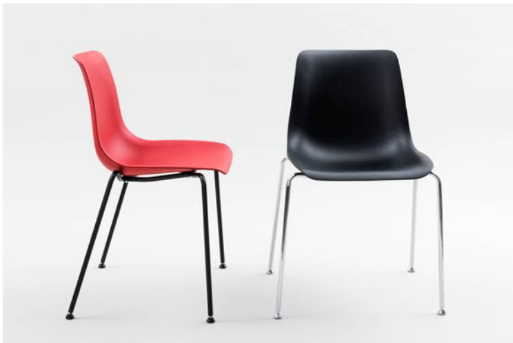
JOY_V Buche lackiert rot pulverbeschichtet schwarz