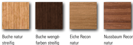
Buche natur streifig