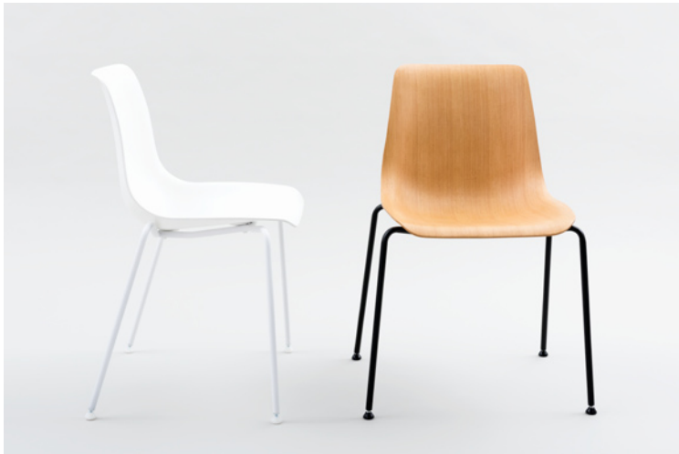
JOY_V Buche lackiert weiß pulverbeschichtet weiß