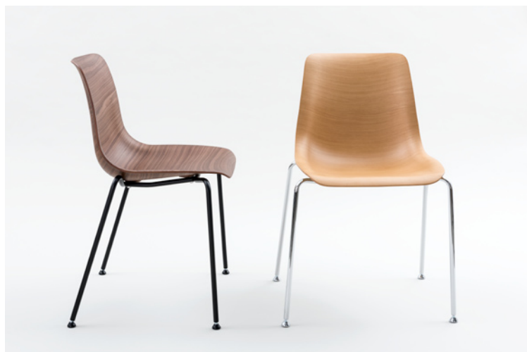
JOY_V Nussbaum Recon natur pulverbeschichtet schwarz