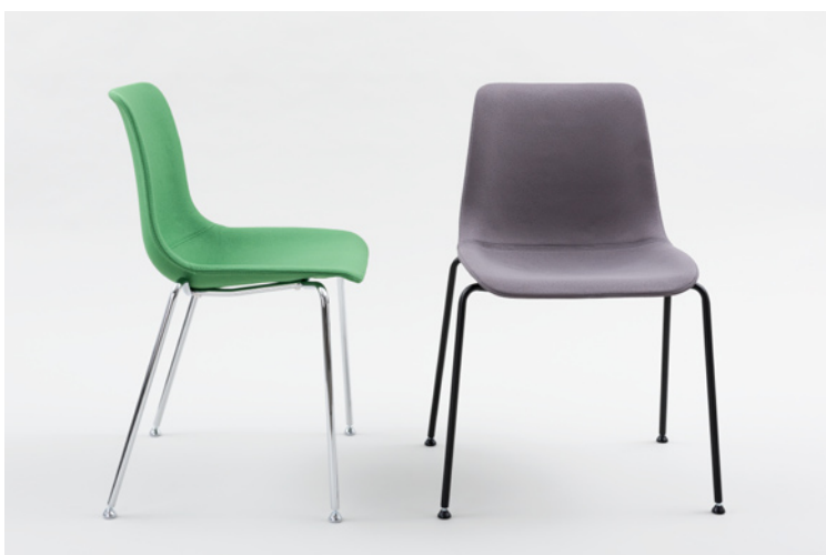
JOY_V gepolstert verchromt