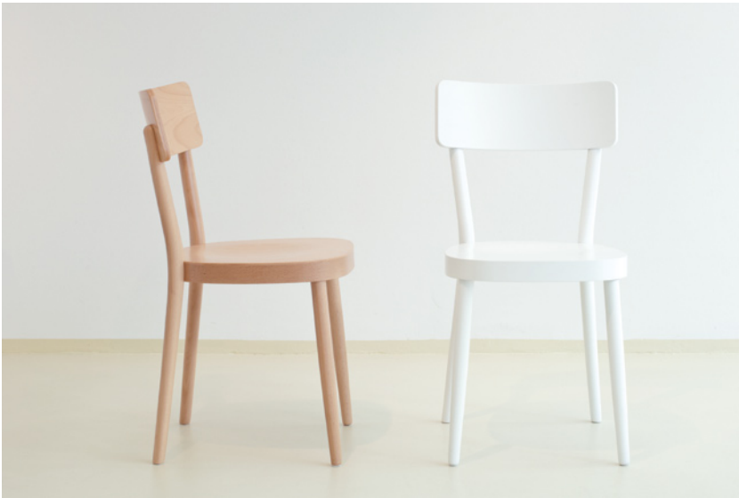
Abbildung Buche natur