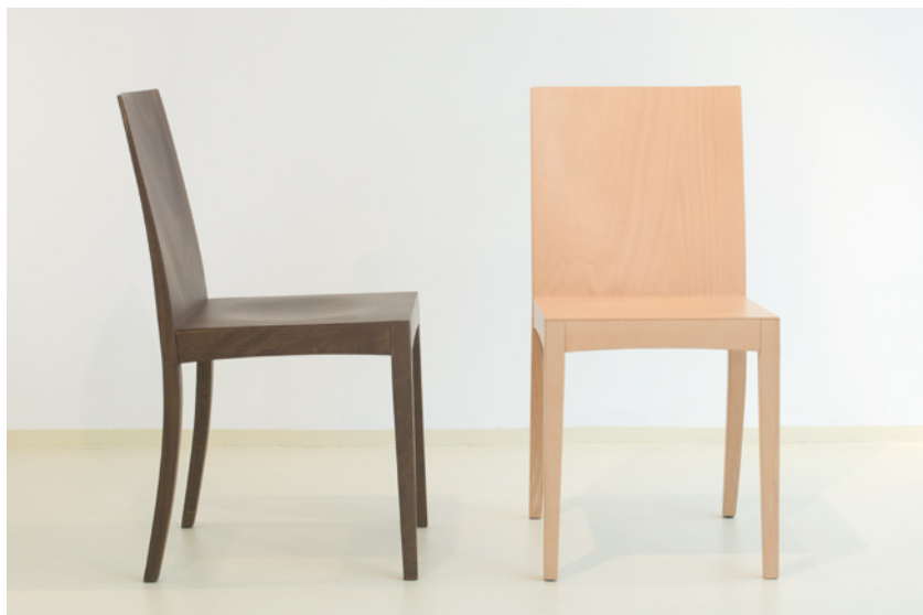
Abbildung Buche wengéfarben gebeizt