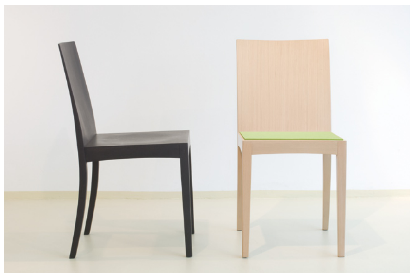
Abbildung Eiche wengéfarben gebeizt